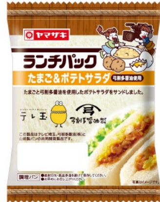
●パッケージは醤油の木桶をイメージしたデザイン