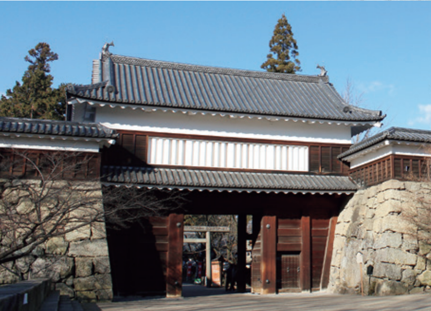
上田城東虎口櫓門

信州上田「お得な宿泊プラン」は、さいたま市を核とした、東日本を元気にするための「東日本連携・創生フォーラム」による、さいたま市と長野県上田市の連携事業です。